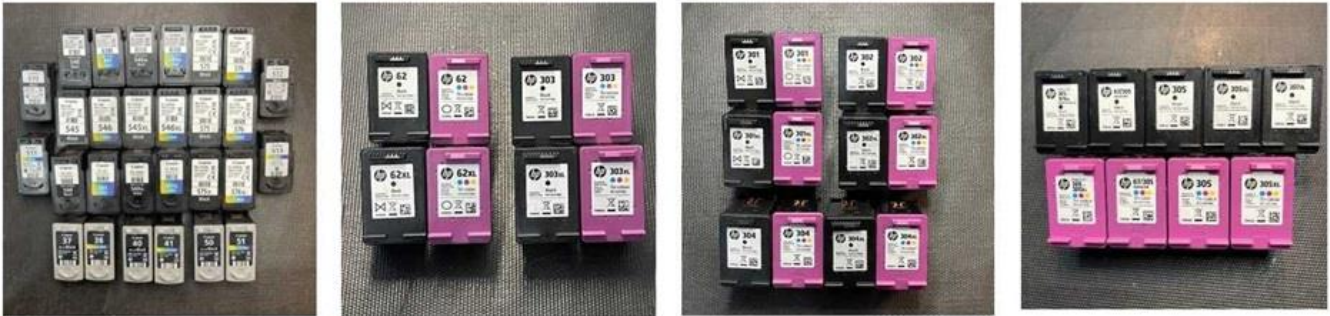
Ankauf leere Druckerpatronen Canon und HP Tintenpatronen leer verkaufen uns!

Die rosa Spalte in der Ankaufliste rechts, sind die Ankaufpreise für leere, halbvolle und volle Kompatible, Refills etc.