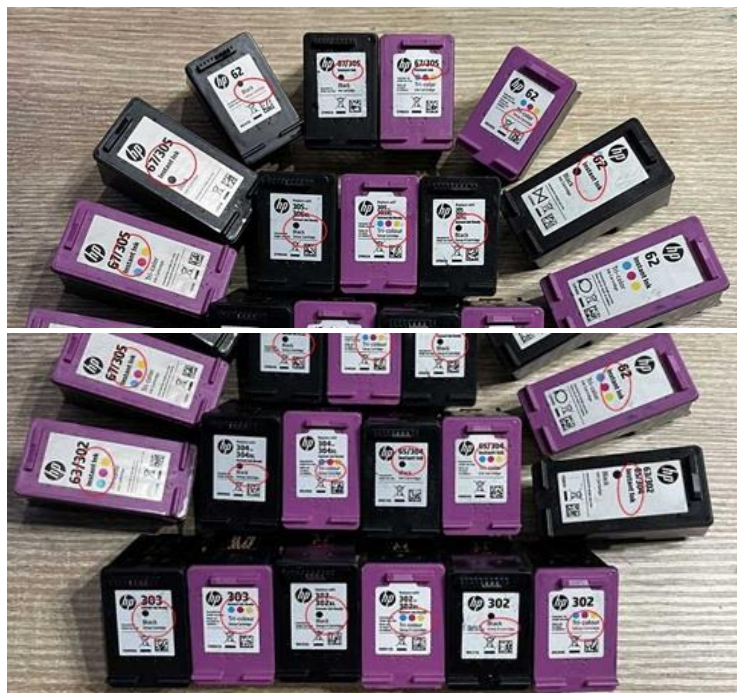
NEU: Ankauf leere HP Instant Ink Patronen, auch volle zum Leergutpreis für umweltfreundliches Remanufacturing!

Siehe rote Markierung, dort steht Instant Ink und/oder Setup.