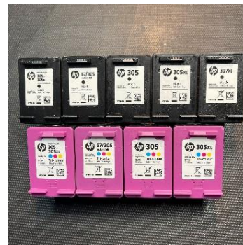
HP Patronen Ankauf: Leere Druckerpatronen verkaufen, Ablauf