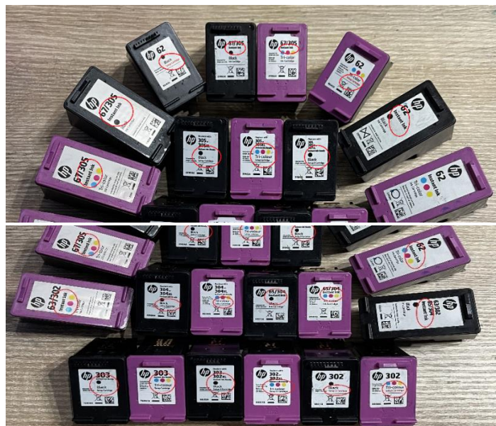
HP Instant Ink Patronen Ankauf: Leere Instant Ink Druckerpatronen von HP verkaufen, Ablauf

Siehe rote Markierung, dort steht Instant Ink und/oder Setup.