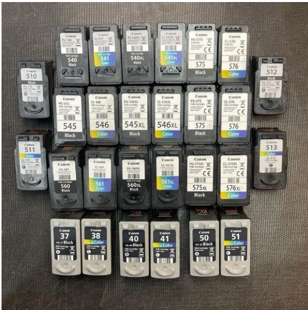
Canon Patronen Ankauf: Leere Druckerpatronen verkaufen, Ablauf

Die rosa Spalte in der Ankaufliste rechts, sind die Ankaufpreise für leere, halbvolle und volle Kompatible, Refills etc.